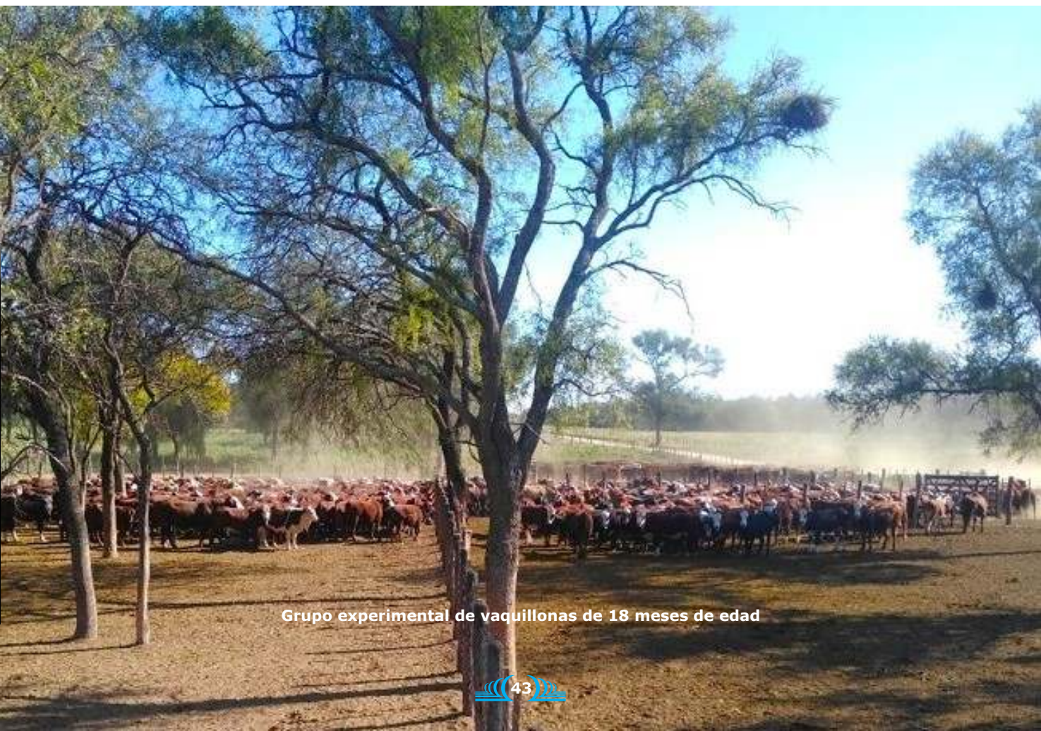
Grupo experimental de vaquillonas de 18 meses de edad