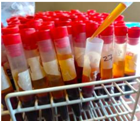
Determinación de hormonas en plasma bovino