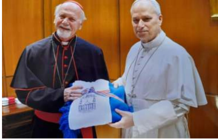
El Arzobispo de Santiago del Estero Vicente Bokalic entrega el obsequio de Ancestral Criollo al Papa León XIV