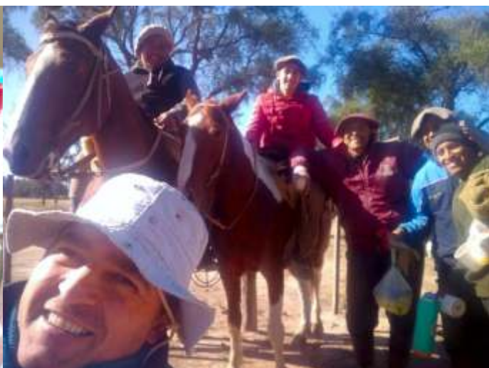
Personal del establecimiento y técnicos del INTA